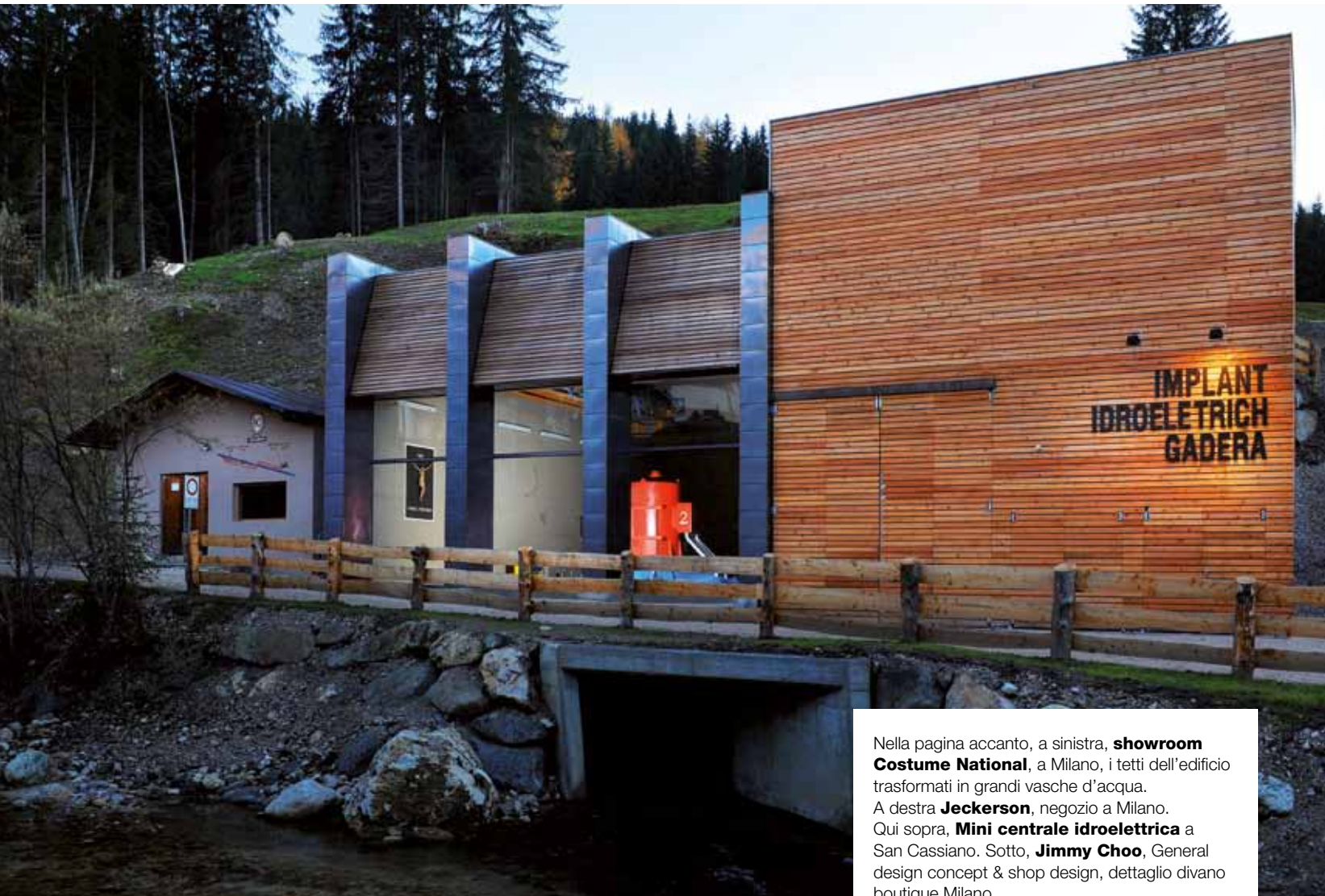
Nella pagina accanto, a sinistra, showroom Costume National , a Milano, i tetti dell'edificio trasformati in grandi vasche d'acqua. A destra Jeckerson , negozio a Milano. Qui sopra, Mini centrale idroelettrica a San Cassiano. Sotto, Jimmy Choo , General design concept & shop design, dettaglio divano boutique Milano.

nella moda, come il lavoro di cantastorie e in questo approccio narrativo per noi è fondamentale il principio per cui usiamo i nostri attrezzi di designer e architetti per raccontare una storia; la moda ci ha insegnato questo. Ma la moda è un fenomeno complesso e quindi non può essere affrontato con un discorso generico.