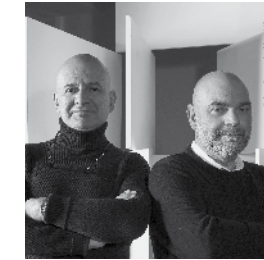
Ph. Crazzelli d'Vigo

The concept behind the exhibition entitled "Water, light and wellness. A contemporary alpine architecture" hosted by the Milan Triennale is the brainchild of Vudafieri-Saverino Partners, in conjunction with Cristofori Santi Architetti. The exhibition displays the results of the competition to design a wellness spa at Ponte di Legno (Brescia), set amidst the mountains of Lombardy and Trentino. The exhibition showcases the premises inside which the competition's five projects are outlined. The distribution of the projects provided an opportunity to create a display system divided into modules using 18 display stands made of natural beech plywood and untreated iron, grouped together to recall the petals of a flower. The two-sided display stands have a double surface set at an angle, offering a quick summary from the outside, and a calmer, more in-depth read from the inside. The result has proven to be a dynamic, continuous path of circulation and pauses, through which visitors are able to gain a deeper understanding of the proposals, as well as the profiles of the five project teams, not to mention the context in which the spa centre will be located.