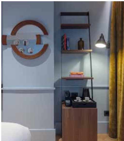
Gli arredi delle camere, come in gran parte quelli di tutto l'hotel, sono disegnati su misura da Vudafieri-Saverino Partners. As throughout most of the hotel, the bedroom furniture is custom-designed by Vudafieri-Saverino Partners.

contrastano rispettivamente con i tendaggi di Dedar in color blu di Prussia, arancio Persia e giallo Ambra. Oltre a pezzi tra gli altri di Arflex, Bonacina 1889, Calligaris, Muuto, gli arredi sono stati disegnati dagli architetti. I riferimenti ai simboli più iconici di Milano, la moquette dal patchwork geometrico e dal fascino vintage lungo i corridoi, il dialogo tra superfici e rivestimenti, riflettono una scelta d'interior studiata su misura, che rispecchia le due anime della milanesità contemporanea: il mondo del business e quello della creatività, di cui il quartiere di Brera è uno dei simboli.