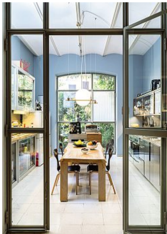
Sopra, la porta vetrata con i profili metallici uguali alle finestre. A destra, i quattro frigoriferi sovrapposti e le miniature di elettrodomestici. Sotto, la collezione di vasi in vetro